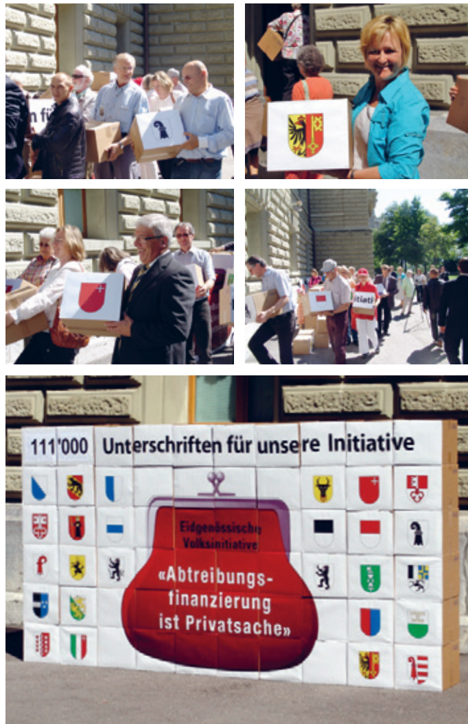
Impressioni dalla consegna delle firme a Berna il 4 luglio 2011.

Per essere accettata, un'iniziativa popolare necessita della maggioranza di Popolo e Cantoni (doppia maggioranza). In altre parole, a favore dell'iniziativa deve esprimersi sia la maggioranza dei votanti, sia quella dei Cantoni. Tale è il nostro obiettivo con «Il finanziamento dell'aborto è una questione privata»!