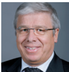
Peter Föhn Copresidente del comitato d'iniziativa, Consigliere nazionale

La maggior parte delle persone non sarebbe mai intenzionata a ricorrere all'aborto, e neanche vuole essere costretta a pagare per gli aborti degli altri.